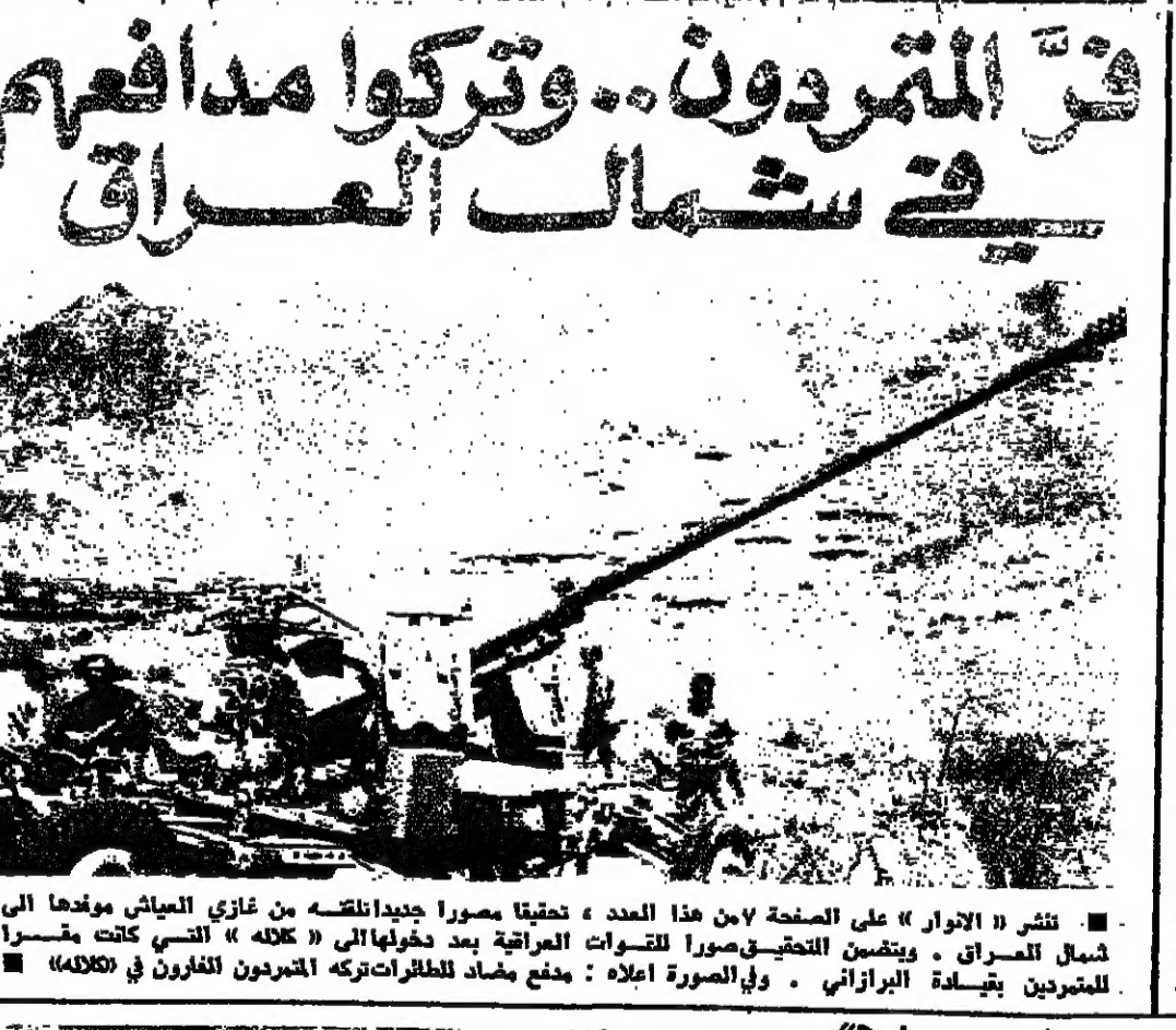
نشر « الأور » على الصفحة ٧ من هذا العدد تحقيقاً معروفاً جديداً نقلته من غازي العياشي مؤرخها إلى شمال العراق . ويتضمن التحقيق صوراً للقوات العراقية بعد دخولها إلى « كلاله » التي كانت مقسّمة للمتمردين بقيادة البرازاني . وفي الصورة أعلاه : مدفع مضاد للطائرات تركه المتمرّدون للفور في « كلاله »